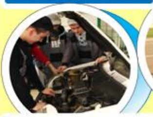
TECHNIK POJAZDÓW SAMOCHODOWYCH